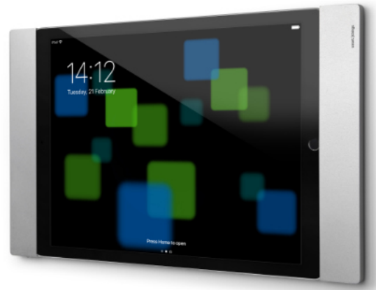
Darstellung mit iPad Pro