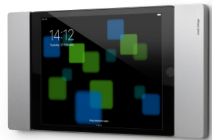
Darstellung mit iPad mini