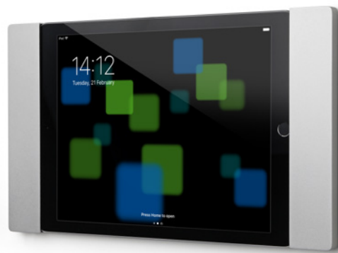
Darstellung mit iPad Air