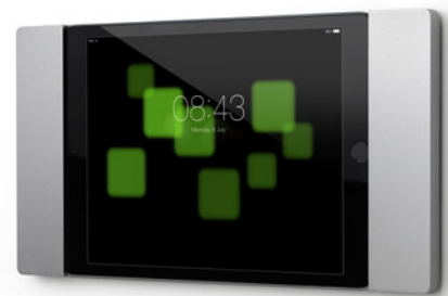
Darstellung mit iPad mini